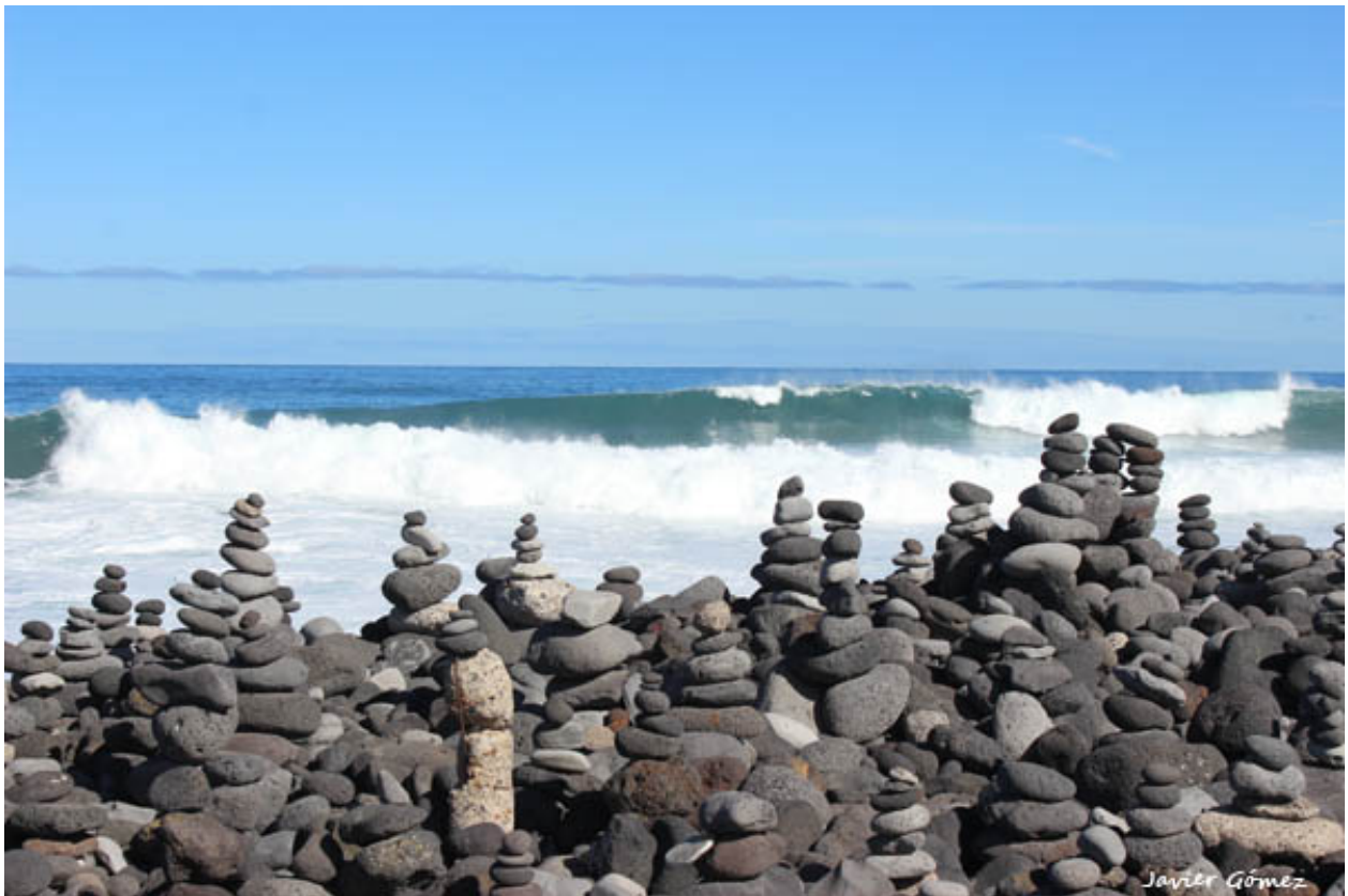
Túmulos de callaos en el litoral del Puerto de la Cruz.

Aunque el problema que estamos describiendo se reproduce en numerosos territorios del Planeta, constituyendo una perniciosa ‘moda’ global, lo cierto es que es a las personas con responsabilidad pública de cada lugar a quienes, junto al conjunto de la ciudadanía, les corresponde afrontarlo y tratar de resolverlo. Es importante destacar al respecto la labor que determinados colectivos sociales y ciudadanos vienen desarrollando ya a este respecto en la propia isla de Tenerife. Así, junto a la labor ya histórica de la Asociación Tinerfeña de Amigos de la Naturaleza, merece destacarse también el trabajo que viene desempeñando la Fundación Canaria Telesforo Bravo - Juan Coello. Esta entidad lleva tiempo denunciando a través de las redes sociales imágenes de agresiones de este tipo,