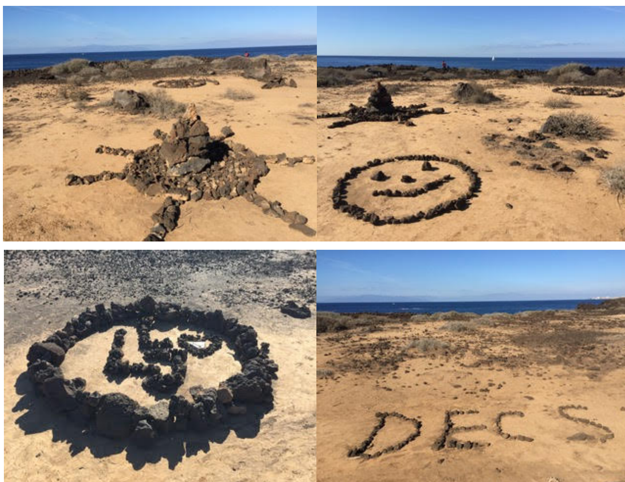
Acumulación de piedras y otros atentados al paisaje en la Reserva Natural Especial de Rasca.

por lo que decidieron dar un paso adelante y convertirlo en una campaña de concienciación para evitar este tipo de conductas. Ha promovido la realización de dos vídeos de diferente duración, que incorporan mensajes claros como: “No amontones rocas”. “No las muevas de su lugar”. “No hagas dibujos en ellas porque alteras y empobreces el paisaje natural y destruyes el hábitat de muchas especies animales y vegetales”. “No destruyas tu entorno”. Y el eslogan principal de la campaña: “ Pasa sin huella ”. La Fundación también advierte en sus mensajes que estos actos constituyen una infracción administrativa sancionada con multa.